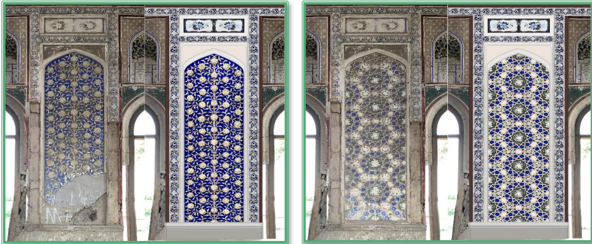
Мирзачорбоғ сарой-богининг интеръери график реконструкцияси (муаллиф фотолари асосида)

иждоларида анъанавий усуллар билан янгича услублар қўлланилганлигига эътибор берадилар. [6, 145-6]